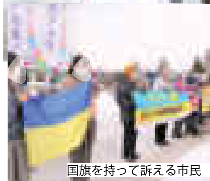
国旗を持って訴える市民