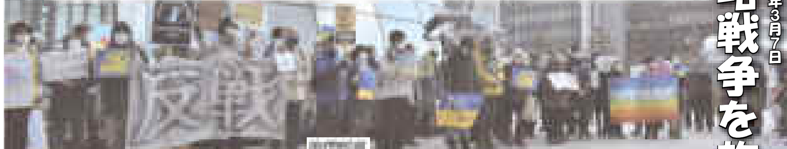
↑いわぶち友参議院議員、札幌駅前の行動

志位さんのオンライン演説会は、このQRコードを読み取るか、YouTube「日本共産党北海道」チャンネルを検索してください