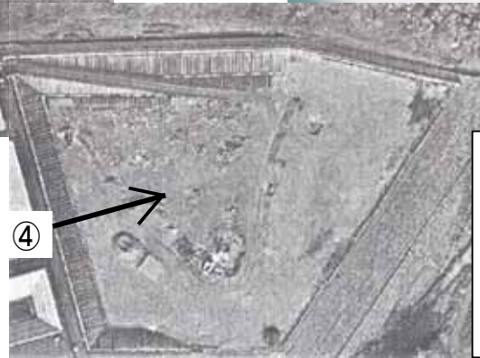
最終処分場 2018年4月より運用開始、埋立期間は、15年間を予定(47%埋立、昨年10月) ・埋立面積 21,600 m 2 ・埋立容量 139,000 m 3 ・付帯施設: 浸出水処理施設