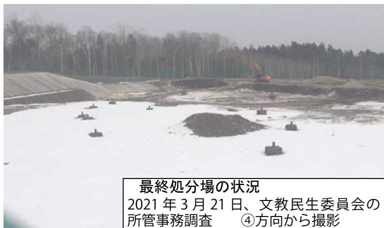
最終処分場の状況 2021年3月21日、文教民生委員会の所管事務調査 ④方向から撮影