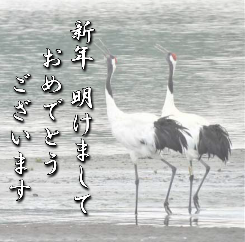
読者からの投稿写真 とう沸湖にて

新年あけましておめでとうございます。 昨年、新型コロナウイルスの感染が世界中を襲いました。日本では感染拡大が急速に広がり、緊急事態宣言を出しながら東京オリンピック、パラリンピックの開催を強行しました。専門家もオリ・パラの開催で感染が爆発的に増える指摘した通りになりました。菅政権の無責任な対応が際立っていたと思います。 感染拡大が日本中に広がる中、網走でも学校や飲食店でクラスタの発生がありました。しかし、検査対象を広