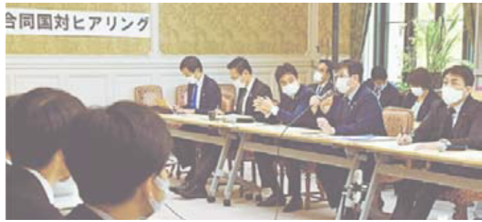
野党合同ヒアリングにて医療従事者や飲食店への支援を求める 12月22日