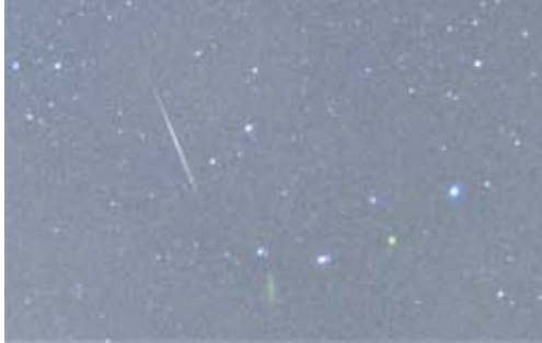
ふたご座流星群 12月14日撮影 読者から投稿