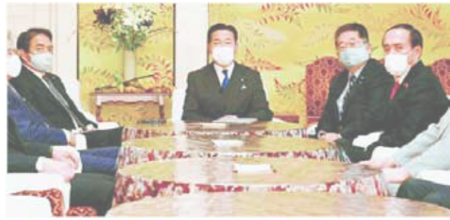
コロナ対応のため、臨時国会延長せよ！ 12月3日、書記局長、幹事長会談