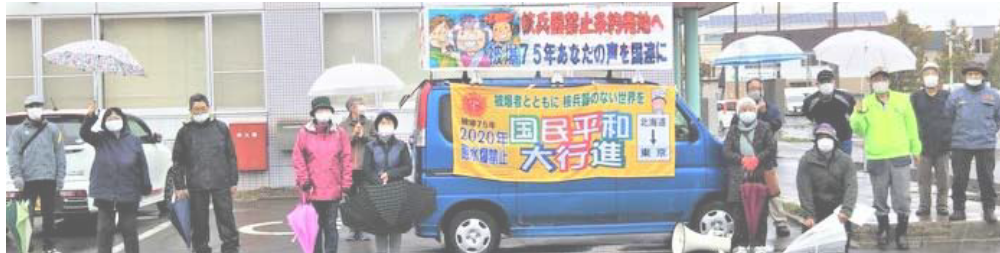
集会後の写真撮影

5月10日(日) 午後1時30分から雨の降る中ですが、2020年国民平和大行進網走コース出発式を行いました。