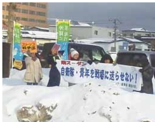
新成人おめでとう!

女性の人達は、宣伝にきた民進党の人達とも声を掛け合っていました。 今年の新成人の対象者は378人ですが、会場には228人の出席でした。