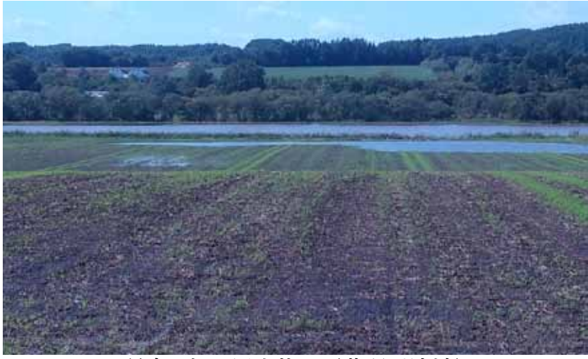
稲富の畑の冠水状況（藻琴川流域）

網走気象台によると、雨は15日に断続的に降り、16日朝から本格的に豪雨が降り続け日付の変わる17日未明には止まりました。15、16日の雨量は網走124ミリ、藻琴川の上流の東藻琴でも127ミリ降りました。