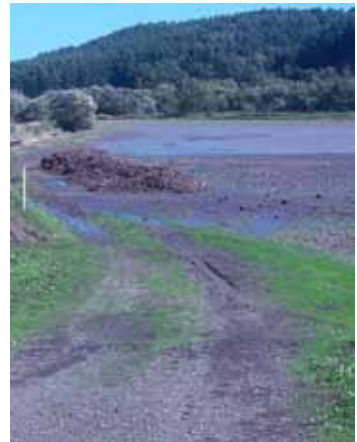
稲富の畑の冠水状況（千草川流域）

路面洗掘、路面崩壊等では、ピットカリ線（明治地区）、稲富旭線（稲富地区）など73箇所、●河川被害では、取り付け道路被害等で、豊栄川（山里地区）、第2千草川（稲富地区）の2箇所、●農業関係で、藻琴川流域の山里、稲富、丸万と越歳川流域の卯原内で、川の氾濫により農地4箇所約23.56ヘクタールが冠水し、馬鈴薯と甜菜（ビート）が泥水に浸かりました。被害総額は、現時点（18日）では集計ができていないとのことでした。