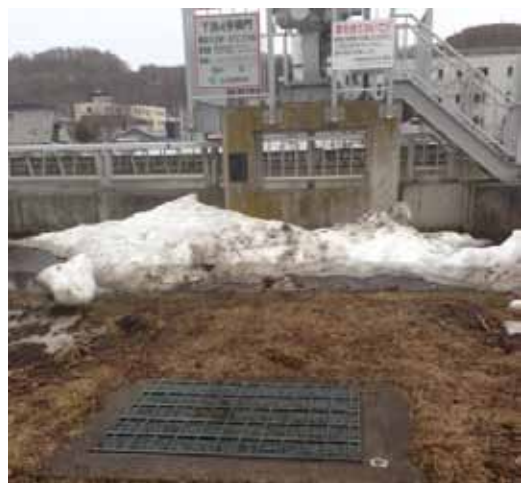
緑町の樋門（ひもん）