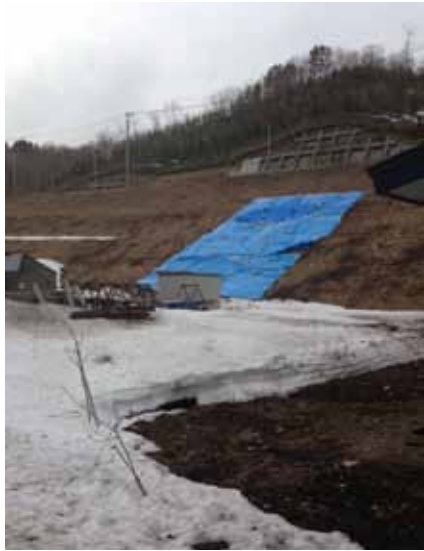
西山通線の法面崩壊

今回の低気圧は、瞬間最大風速は25.2㍎、総降雨量も12.0㍎と比較的少なかつたですが、数日来続く融雪による地盤のゆるみが一規模ですが、被害が出ました。