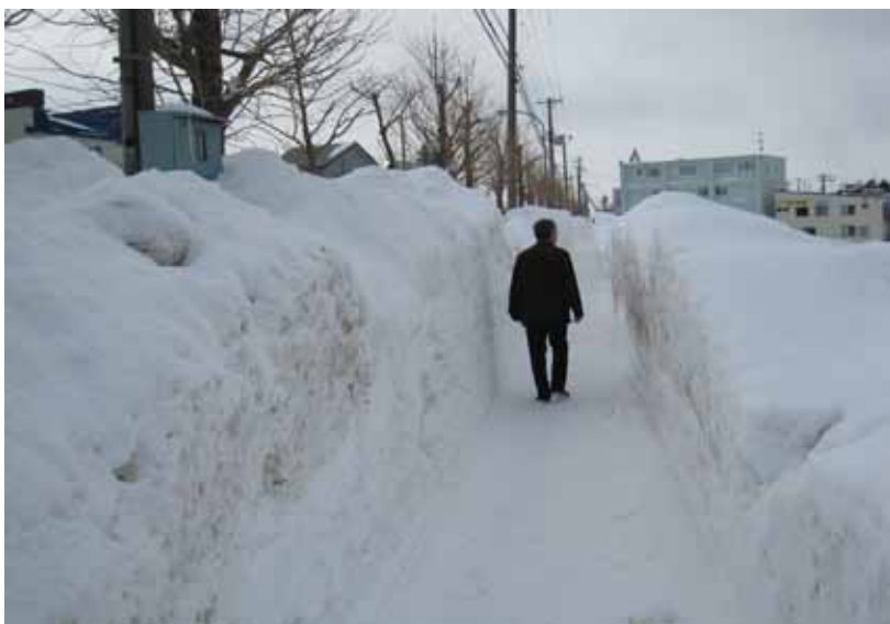
背丈より高く積もった中園網走停車場線の通学歩道

最後に議員団は、今回、申し入れた網走市、オホーツク総合振興局、網走開発建設部に対し「市と道・国の三者が十分連携をとり、状況を把握しながら効率的な除排雪を行ってほしい」と要望しました。